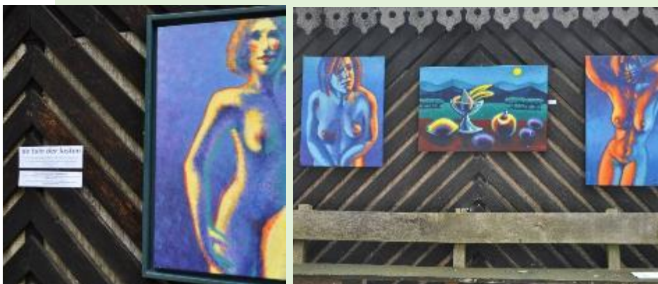
Juni: Midzomer festival Tuin der Lusten