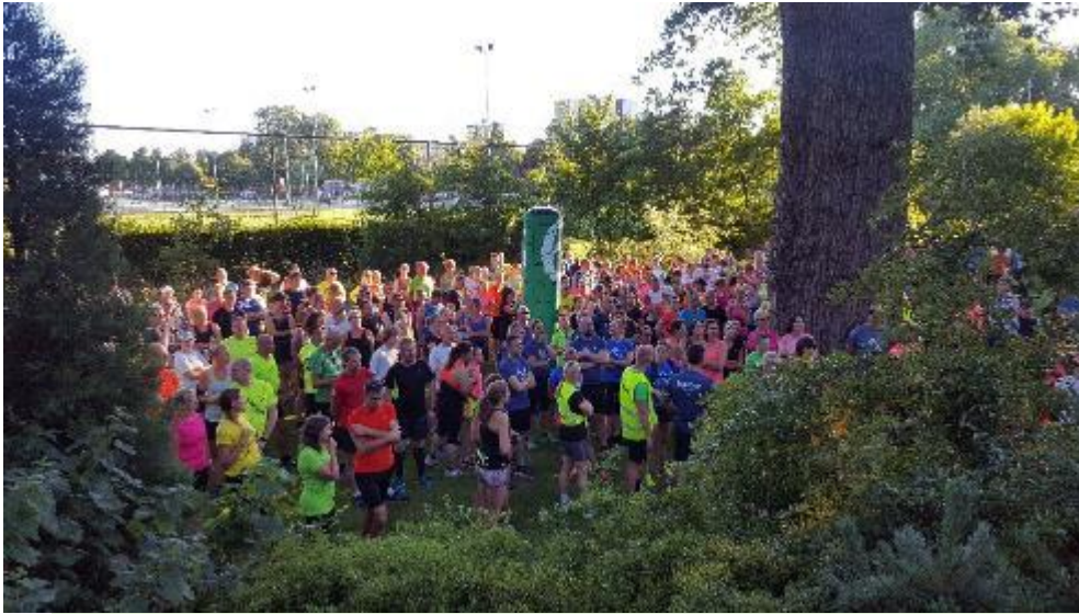
Juli: Hortus Botanicus Run