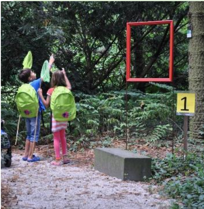
Augustus: Jeugd Vakantie Paspoort