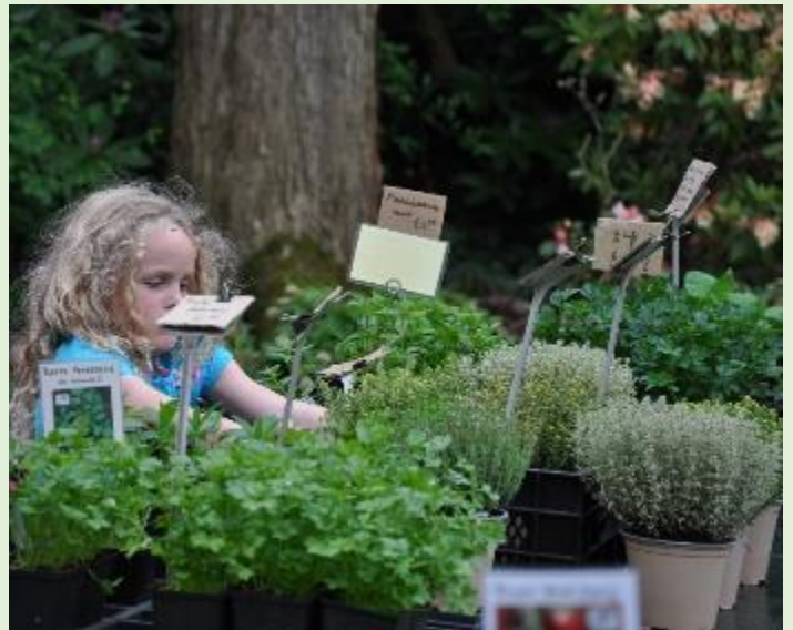
Mei: Voorjaars-Plantendagen: een bezoeker neemt trots zijn aankopen mee naar huis