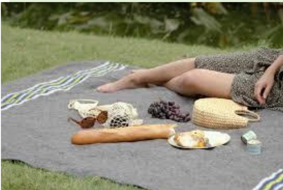
Pique Nique Botanique