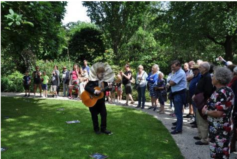
Midzomer Festival Midzomer Festival in Kralingen optreden theatergroep in de tuin